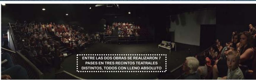
ENTRE LAS DOS OBRAS SE REALIZARON 7 PASES EN TRES RECINTOS TEATRALES DISTINTOS, TODOS CON LLENO ABSOLUTO