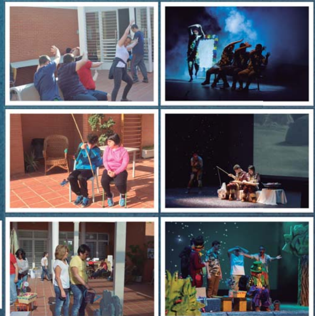
IMÁGENES DURANTE LOS ENSAYOS E IMÁGENES DURANTE LAS REPRESENTACIONES