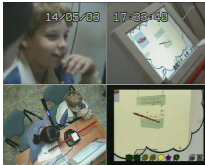
Persona con Autismo utilizando la herramienta 'Voy a hacer como si...'

Se presentarán los resultados y conclusiones de la investigación sobre el uso de esta herramienta en un grupo de personas con trastornos del espectro del autismo de Valencia. Estos resultados han sido publicados ya en distintas revistas o libros nacionales e internacionales.